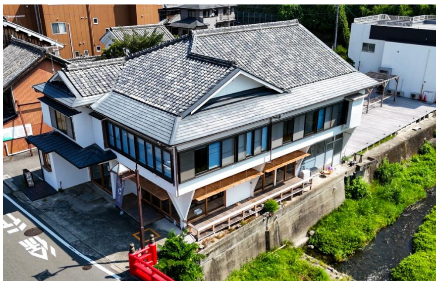
粉河寺の中門すぐ近くの「MIKASAKAN」（施設全景）

当社は、地域再生と共感投資を組み合わせたエリアリノベーションを全国で展開しており、紀の川市では 2023 年度より粉河エリアの活性化に取り組んでいます。大正期に創業した旧旅館をリノベーションし、カフェ・サウナ・宿泊施設として再生した「MIKASAKAN」は、2024 年 6 月に開業。オープンデッキでは、同年 12 月から毎月第 2 日曜日に「こかわつなぐマルシェ」を開催し、地域の交流拠点として成長を続けています。