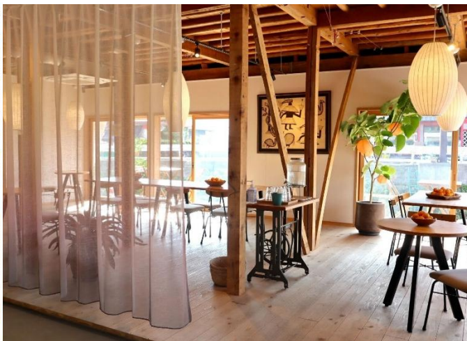
リニューアルイメージイラスト（左）、カフェ店内（右）